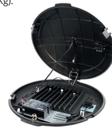
Dimensões: raio 53cm, altura 12cm