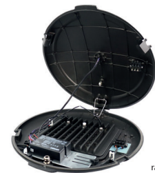
Lamp dimensions: radius 53cm, height 12cm