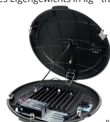
Abmessungen der Straßenbeleuchtung: Radius 53cm, Höhe 12cm