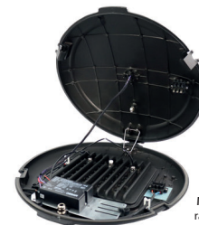
Medidas de la farola: radio 53cm, alto 12cm