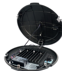
Mesures du lampadaire: rayon 53cm, hauteur 12cm