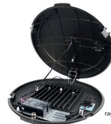
Misure lampione: raggio 53 cm, altezza 12 cm